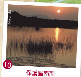
10 保護區南面 專為野生生物而設的寧靜地帶，遊客請止步。