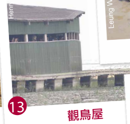
13 觀鳥屋 在秋季至翌年春季潮漲期間，從觀鳥屋往外看，可見數以千計的水鳥。