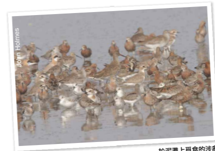
於泥灘上覓食的涉禽

這片面積380公頃的保護區由潮汐蝦塘「基圍」、紅樹林、蘆葦叢、淡水生境和泥灘組成，形形色色的濕地在大自然中扮演著重要的角色。