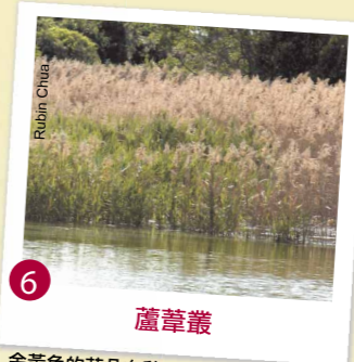
6 蘆葦叢 金黃色的花朵在秋天綻放，值得一看。