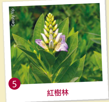
5 紅樹林 近距離接觸紅樹林。