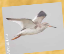
紅腳鷸 (見於每年2月至5月及7月至10月)

在香港的8種真紅樹中，7種可在米埔發現。米埔的紅樹林更是全港最大的一片紅樹林群落。