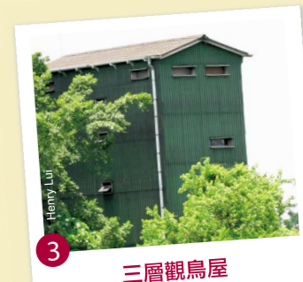
3 三層觀鳥屋 在這裡可欣賞米埔和后海灣全景。