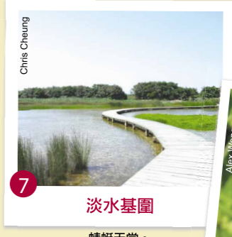
7 淡水基圍 蜻蜓天堂。