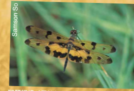
斑藍翅蟌 (見於每年5至10月)