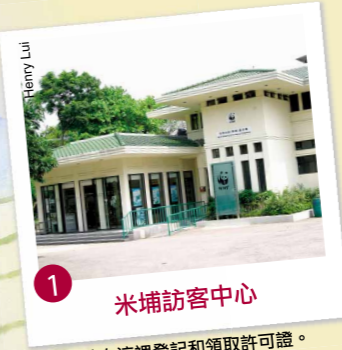
1 米埔訪客中心 請在這裡登記和領取許可證。