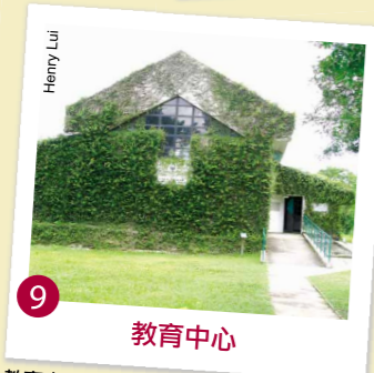
9 教育中心 教育中心內設展覽廳、洗手間和飲水器。