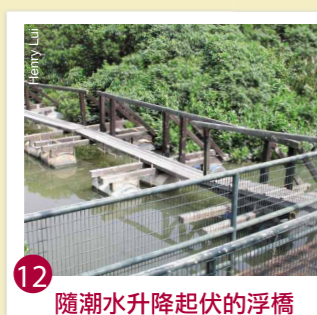
12 隨潮水升降起伏的浮橋