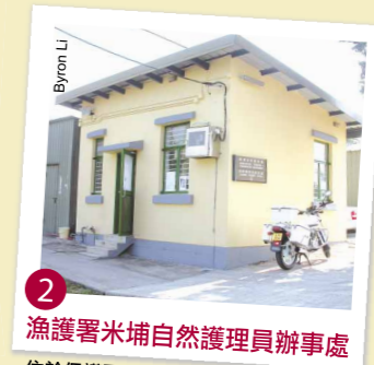
2 漁護署米埔自然護理員辦事處 位於保護區入口，請在此檢查許可證，然後進入保護區範圍。