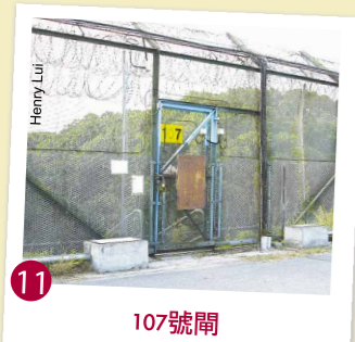
11 107號閘 由香港警務處管轄，訪客必須取得邊境禁區通行證方可進入禁區範圍。107號閘的開放時間為上午8時至下午6時。