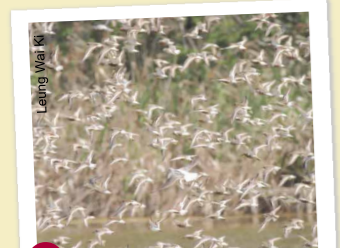
8 16/17號基圍 大批遷徙水鳥和留鳥在基圍聚集及覓食，尤其在潮漲和晚間時份。考考你的眼界，看看你一共發現多少種雀鳥？