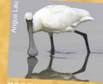
黑臉琵鷺 (每年約有全球種群中的五分之一在後海灣過冬。(見於每年11月至翌年4月))