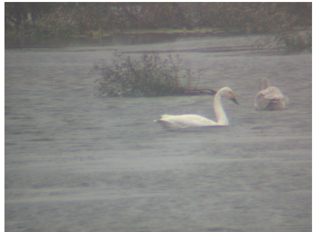
圖2：南匯東灘的小天鵝 Cygnus columbianus →