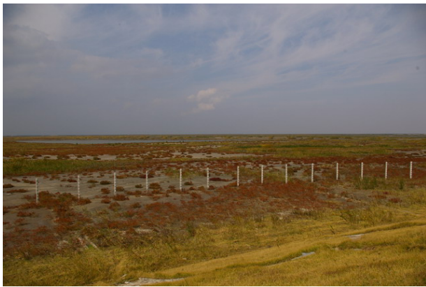
← 圖1：位於南匯東灘的鹹水沼澤

這個為期一年的保育項目是由上海綠洲野生動物保護交流中心於南匯東灘進行。南匯東灘是國內新列為重點鳥區（IBA）地點之一。針對當地已展開的城市發展計劃，中心將以觀鳥活動、講座、工作坊和印刷小冊子聯繫各相關人士（包括當地居民及在附近工作人士，以及政府和發展商），以提升公眾意識及引導當地政府和發展商開展保護當地濕地的計劃。南匯東灘多種不同類型的濕地生境為多種遷徙水鳥，包括白鶴 Grus leucogeranus 、黑臉琵鷺和黃嘴白鷺等國際具保育價值品種，提供棲息及覓食地。