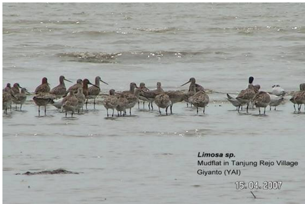
←圖1：北蘇門答臘Tanjung Rejo 村泥灘上的遷徙濱鳥

蘇門答臘雨林研究中心（Sumatra Rainforest Institute）將於印尼北蘇門答臘舉行兩個關於水鳥普查的培訓，對象為當地非政府團體及學生組織。項目選址是重點鳥區（IBA），為包括黑尾膝鶉 Limosa limosa 等國際具保育價值遷徙濱鳥的中途站及越冬地。透過培訓，參加者可學習針對水鳥普查的雀鳥辨識及調查技巧。30位來自14個不同組織的人員將接受培訓，並成為將來水鳥普查的重要人力資源。