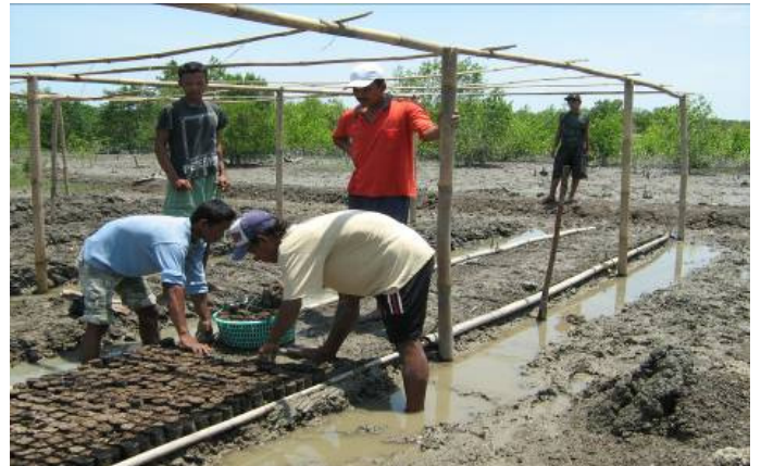
圖2：由當地社區組織建立的紅樹苗圃→