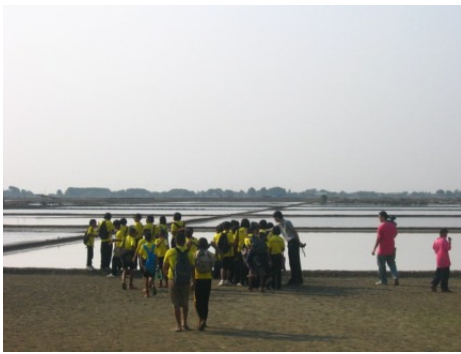
←圖1：實地考察讓青少年能與重要濕地更親近

泰國雀鳥保育協會（The Bird Conservation Society of Thailand, BCST）將於泰國內海灣舉行一連串的保育教育項目。項目選址的泰國內海灣是重點鳥區（IBA），於遷徙季節及冬季可發現逾35種國際具保育價值濱鳥，其中包括半蹼鶯 Limnodromus semipalmatus 、棕頭鷗 Larus brunnicephalus 以及勺咀鶯 Eurynorhynchus pygmaeus 。項目旨在提升公眾對鳥類保育、重點鳥區及濕地的重要性的意識，同時向相關人士介紹可持續性地運用濕地資源的概念。組織將在泰國內海灣一帶的學校及村落籌辦工作坊、實地考察及學校探訪，並製作宣傳資料。預計約一萬名當地居民、青少年及學生可接收到濕地和鳥類的資訊。項目將為期一年。