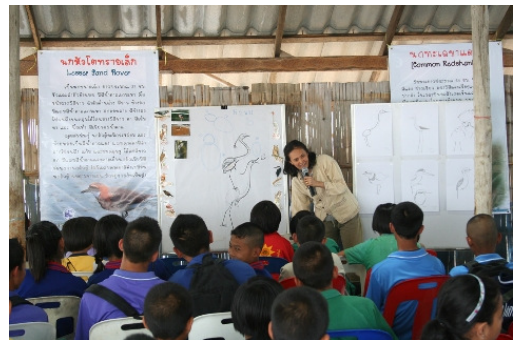
圖2：學校探訪組往學校進行鳥類保育講座